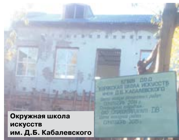
Окружная школа искусств им. Д.Б. Кабалевского

А затем пришел Ельцин Б.Н., сумевший добиться в стране введения поста Президента (смахивает на трон царя), который «передал по наследству» Путину В.В. На период их правления с 1990 по нынешний год приходится разрушение в моей Палане созданного в предшествующие годы.