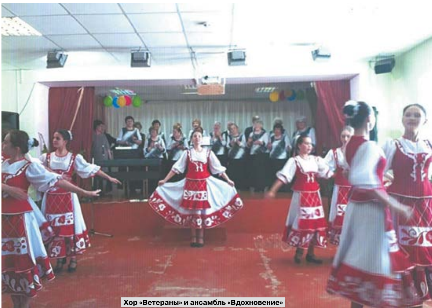
Хор «Ветераны» и ансамбль «Вдохновение»

«Юбилей, юбилей – это вовсе не старость, Это зрелой красы благодатный рассвет!»